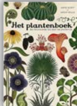
"Het Plantenboek" - 25,99 euro

Klaar voor een betoverende ontdekkingstocht door de natuur? Duik in ons kleurboek, gevuld met prachtige tekeningen van planten en dieren. Elke pagina beidt boeiende weetjes en interessante teksten, zodat je niet alleen kleurt, maar ook leert. Laat je creativiteit de vrije loop en beleef uren plezier terwijl je de natuurlijke schoonheid verkent. Haal vandaag nog jouw exemplaar en maak deze winter kleurrijk en educatief!