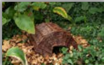
Egelmand (Groot) - 17,85 euro

Verwen tuinvogels met ons biologische strooivoer en zie hoe je tuin tot leven komt! Ons voer is gezond en smakelijk, perfect voor vogels. Bovendien, met onze tuinvogel poster, kun je de verschillende soorten vogels identificeren die je tuin bezoeken. Maak je tuin een paradijs voor vogels en bewonder hun pracht!