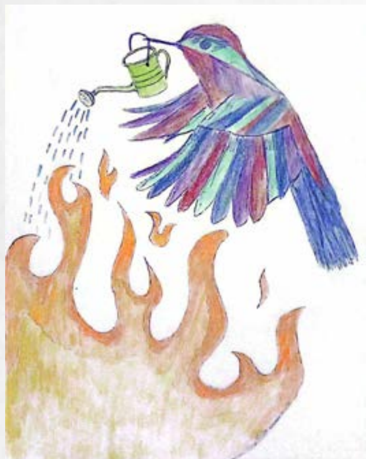
Illustratie door Roos Van Elsen

Kijk! Roept een van de apen. De kolibrie! Ze zien dat de kolibrie naar de rivier komt. Hij duikt naar het water, en keert zich terug om. Terug het bos in, hij vliegt recht naar de brand! Pas op! Roepen de dieren samen. Hij neemt bij de rivier een druppeltje water in zijn bekje, en vliegt het bos in. Daar laat hij het druppeltje vallen in het vuur. Telkens opnieuw vliegt hij dapper aan en af. Hij weet goed dat hij het vuur zo niet kan blussen. Zeker niet op zijn eentje. Hij voelt zich angstig en wanhopig, net als de andere dieren. De kolibrie weet wat hij doet. Hij kan zich niet verstoppen voor het vuur. Hij zal zich niet verstoppen. Hij houdt van het bos, hij houdt van alle bomen. Ze hebben hem zolang een thuis geboden. Terwijl ze door het vuur verteerd worden, brandt zijn hart mee. Hij zal alles doen wat hij kan, om ze tegen het vuur te proberen beschermen.