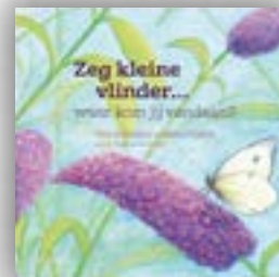
Zeg kleine vlinder... (boek) - 13,50 euro

Samen met alle andere insecten zien we in de lente ook de vlinders weer vrolijk rondfladderen. Wil jij alles over dit beestje te weten komen? Dan is dit boek zeker iets voor jou! Ontdek spannende dierenverhalen, leuke weetjes over de vlinder en nog veel meer in dit boek. Wist jij bijvoorbeeld dat een koolwitje maar 10 tot 20 dagen leeft?