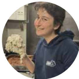
DOOR Nel Top

Fietstochten, herfstwandelingen, zwerfvuilacties, peddelavonturen, ruitertochten, buurtfeesten, picknicks, fotozoektochten en nog veel meer... Tijdens de Dag van de Trage Weg komen duizenden wandelaars, fietsers, ruiters en andere enthousiastelingen een weekend lang samen op en langs trage wegen. Dit jaar is dat op 19 en 20 oktober .