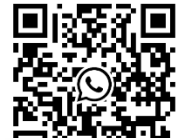
JNM Brugge gewone leden 😊 groep WhatsApp-groep