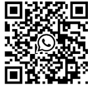
JNM Brugge ini groep WhatsApp-groep